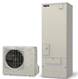
ヒートポンプ給湯機（エコキュート）

※高効率給湯器の導入と併せて蓄熱暖房機または電気温水器を撤去する場合、加算補助。