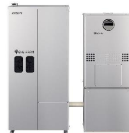
家庭用燃料電池（エネファーム）