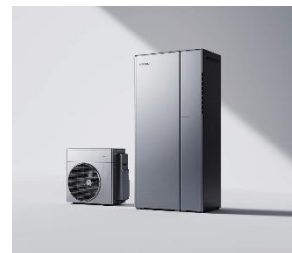
ハイブリッド給湯機